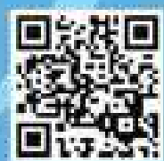
ลงทะเบียนออนไลน์